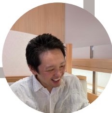
AKIRA SHIGENOBU 重信 亮